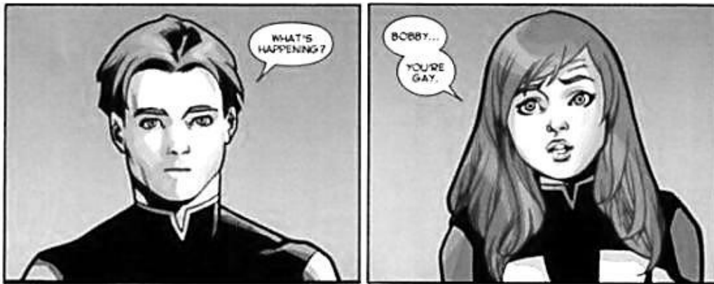
Viñeta de 'El hombre de hielo'.

1 Hasta hace unos años, los superhéroes homosexuales se podían contar con los dedos de 2 una mano. Ninguno de los que salía del armario lograba saltar al primer plano. Hablaban 3 de su sexualidad solo para contentar a un segmento de público y así acallar los 4 comentarios. Pero las cosas parecen estar cambiando. En el último número de All-New X- 5 men, El Hombre de Hielo, uno de los mutantes originales de la Patrulla X, ha reconocido ser 6 gay. La historia, eso sí, tiene trampa: el que ha hecho la confesión no es el Bobby Drake 7 adulto que los lectores han conocido durante cinco décadas (que sigue siendo 8 heterosexual), sino una versión juvenil de sus primeros tiempos que ha decidido quedarse 9 a vivir en el presente después de un accidentado viaje en el tiempo.